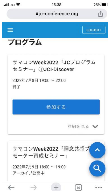
プログラム選択ページ